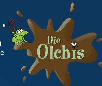
Illustrationen von Erhard Dietl

Veranstalter ist die Stadt- und Kreisbibliothek St. Wendel Verbindliche Anmeldung ab dem 1. Juli direkt in der Bibliothek, per Mail unter: bibliothek@sankt-wendel.de oder telefonisch unter: 0 68 51 - 809 19 40